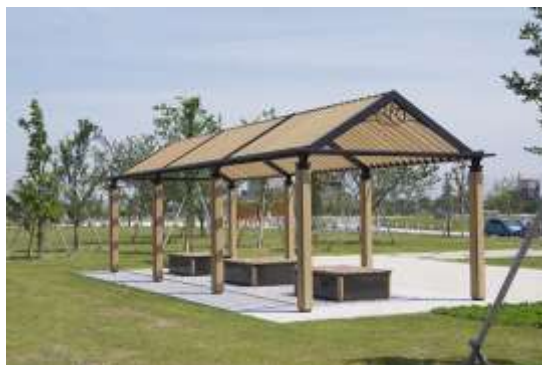
パーゴライメージ