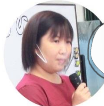
事務局ちゃっぴー

この会では「こんなことできたらいいな！」など自由に語り合って… 参加者同士がまちで会った時 会釈し合うような関係ができれば うれしいなと思います。