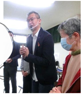
進行役のタケノコ

頭の中を活性化させてアイデア出しをすることを「 ブレインストーミング (ブレスト)」と言います。 コツは、 ①質より量！ ②笑いや奇抜さ重視！ ③横取り相乗り大歓迎！