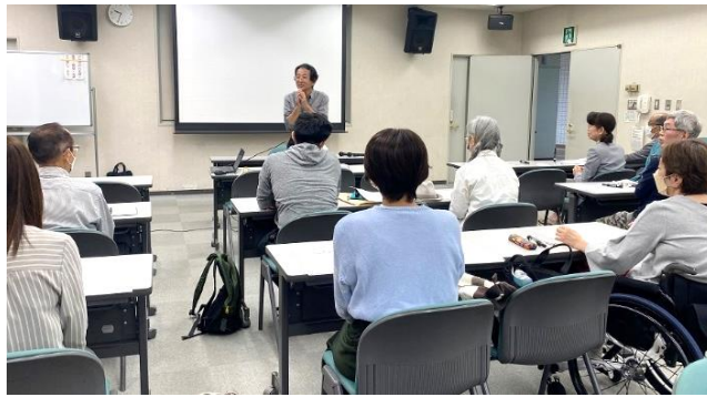
(写真左) 「元気なまちって？」というテーマで、受講生みんなで100個のアイデアを出しました