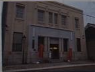
休憩のできる観光交流センター。 甘酒のみやげの駄屋。 信長めしの魚しまなどが近くにある。