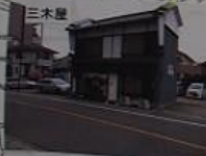
天王通りの和菓子屋。お園子が名物。