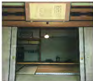
浄光寺・明治天皇佐屋行在所