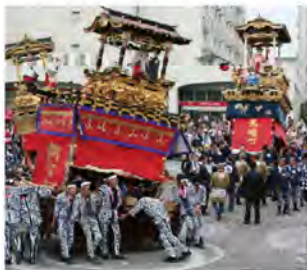
尾張津島秋まつり