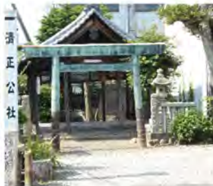
戦国大名加藤清正を祀る・清正公社