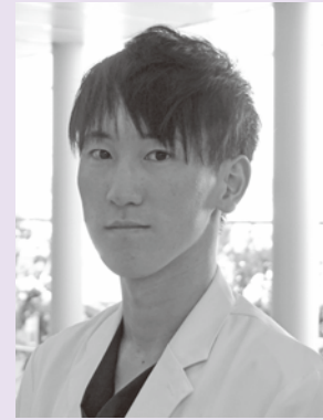
津島市市民病院 脳神経内科 医師