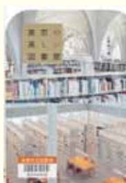
『東京の美しい図書館』 立野井一恵 著 エクスナレッジ

本書は東京とその近郊にある公共図書館、学校図書館、旧図書館の建物について紹介した内容です。