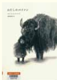
『わたしのバイソン』 ギャヴィズニウスキ 作 清岡秀哉 訳 偕成社

バイソンという動物を知っていますか。顔が毛布のように厚い毛皮で覆われた、とても大きなウシの仲間です。この本は、女の子とバイソンとの出会いから始まるお話です。