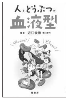
「人とどうぶつの血液型」 近江 俊徳 編著 緑書房