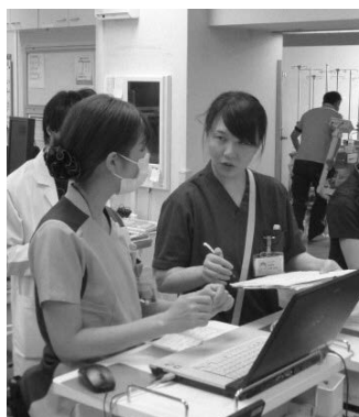
▲看護師指導の様子