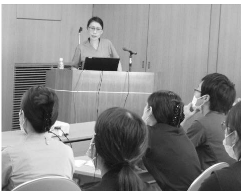
田坂副主任看護師による院内研修の様子

今回のインタビューでは、救急看護認定看護師は救急外来だけでなく、様々な場面で活躍していることが分かりました。