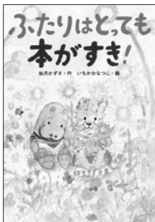
『ふたりはとっても本がすき!』 如月かずさ 作 いちかわなつこ 絵 小峰書店

チーターのチッタちゃんは本を読むのがだいすき。今日も図書館で十さつの本をかりて帰ろうとすると、おなじクラスのカバのヒポくんにバッタリ。ヒポくんは、今かりている一さつの本をもう一度かりるんだって。せっかちなチッタちゃんは大びっくりです。