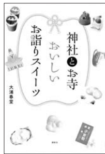
『神社とお寺 おいしいお詣りスイーツ』 大浦春堂 著 講談社

神社やお寺へ参拝に行くと、参道に「お詣りスイーツ」を売るお店が並んでいます。参拝の記念やお土産に買って帰ったことがある方も多いのではないのでしょうか。