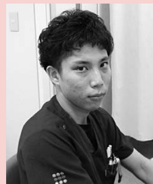
津島市民病院 消化器内科医師