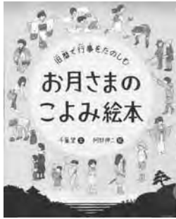
「お月さまのこよみ絵本 旧暦で行事をたのしむ」 千葉望文 阿部伸二 絵 理論社

地球がお日さま(太陽)のまわりを一周するのが一年365日。世界の多くの国々はお日さまの動きによって一年を決めています。でも、昔の日本のカレンダー=こよみは、お月さま中心に作られていました。これを「旧暦」といい、明治5年(1872年)に改められたお日さま中心のこよみを「新暦」といいます。昔の人々は、月の満ち欠けの形を見て、農作業や漁の段取りを決めたり、さまざまな季節の行事を行っていました。日にちや時間を知ったり、時には明かりとして月光を用いることもありました。お月さまのこよみを知ることで昔の人の心によりそい、季節のうつりかわりを身近に感じてみましょう。