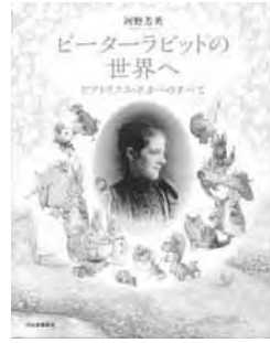
「ピーターラビットの世界へ ビアトリクス・ポターのすべて」 河野 芳英 著 河出書房新社

生誕150周年を迎えたイギリスの絵本作家ビアトリクス・ポターの代表作としても知られる「ピーターラビット・シリーズ」は、世界110か国(35の言語)で出版され、累計発行部数1億5000万部を超えるロングセラーとなっています。本書では、ビアトリクス・ポターの生涯、交流のあった人々、ゆかりの地などの紹介や、物語の誕生秘話、ピーターラビットファミリーの家系図や逸話などが、豊富な挿絵や写真と共に解説されています。今もなお全世界で愛され続けているビアトリクス・ポターの世界をご堪能下さい。