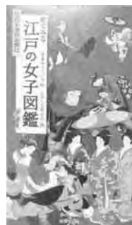
「絵でみる江戸の女子図鑑」 善養寺ススム 文・絵 江戸人文研究会 編 廣済堂出版

今から約400年前の江戸時代。長く平和な時代が続いたため、様々な文化が発展しました。では、当時の女性たちはどのように暮らしていたのでしょうか?