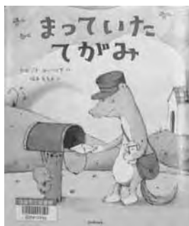
「まっていたてがみ」 セルジオ ルツツィア 作 福本友美子 訳 光村教育図書

レオは小さな村のゆうびん屋さん。まいにち村のみんなにゆうびんを届けています。おしゃべりをしたり、ゲームをしたり、楽しい日々をすごしていますが、まだ自分あてのてがみももらったことがないのでざんねんに思っていました。