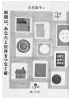
『新聞は、あなたと世界をつなぐ窓』 木村葉子 著 汐文社

いつでも、どこでも、簡単に社会のできごとを知る事ができる新聞。インターネットの発達でたくさんの情報が溢れている今、私たちは正しい情報の選択をする力を養わなければなりません。この力をつける方法の一つが、新聞を読み、社会とつながることです。