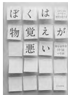
『ぼくは物覚えが悪い』 スザンヌ・コーキン 著 鍛原 多恵子 訳 早川書房

出会う人の顔も、訪れた場所も、日々のひとこまひとこまも、記憶にとどめることができないヘンリー。