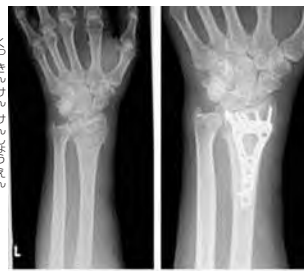
受傷時 プレート固定後