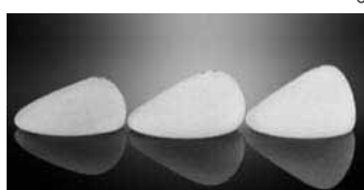
図2 保険適用となった人工乳房