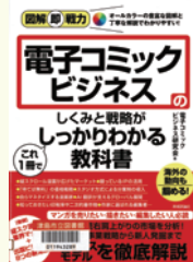
『電子コミックビジネスの しくみと戦略が しっかりわかる 教科書』 電子コミックビジネス 研究会 著 技術評論社

近年、急拡大している電子コミック市場。雑誌の休刊・電子化(Web移行)や文芸書をはじめとする一般書籍の電子化など、年々拡大していく電子書籍市場の中でも、とりわけ紙書籍からの移行率が高いコミック類。10年ほど前はコミック全体の中で2～3割程度だった電子コミックの売上が現在では7割超えと、紙と電子の売り上げが逆転しました。スマートフォンの普及や、待てば無料で読める掲載スタイルも、従来のまんがが読者以外にも広くアプローチすることとなり、市場拡大の一因と言えるでしょう。