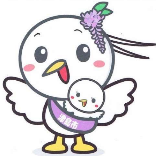
津島市公式子育て応援キャラクター「つしっぴー」 津島市の鳥「シラサギ」をモチーフにし、藤を髪飾りにつけて津島市の 子育てを応援しています。