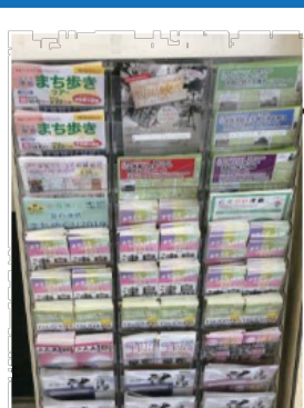
このパンフレットスタンドにあります