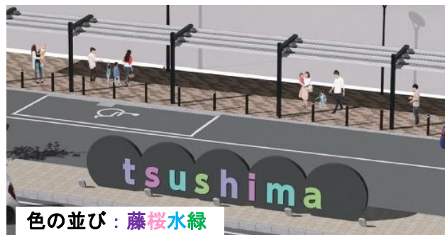
乗降スペース・文字サインのイメージ