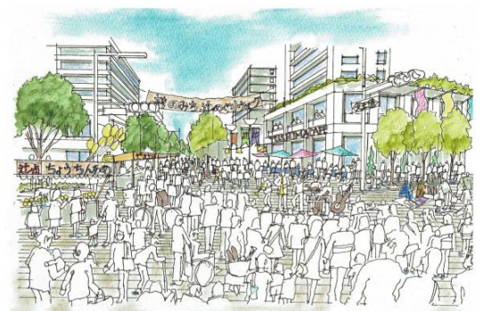
イベント時における駅前のイメージ図 (H29天王通再生プラン最優秀作品より)

※当日は、安心してお越しいただけるよう、 新型コロナウイルス感染症の予防対策を 実施します。