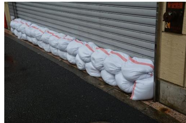
必要時には、速やかに地域住民の元へ