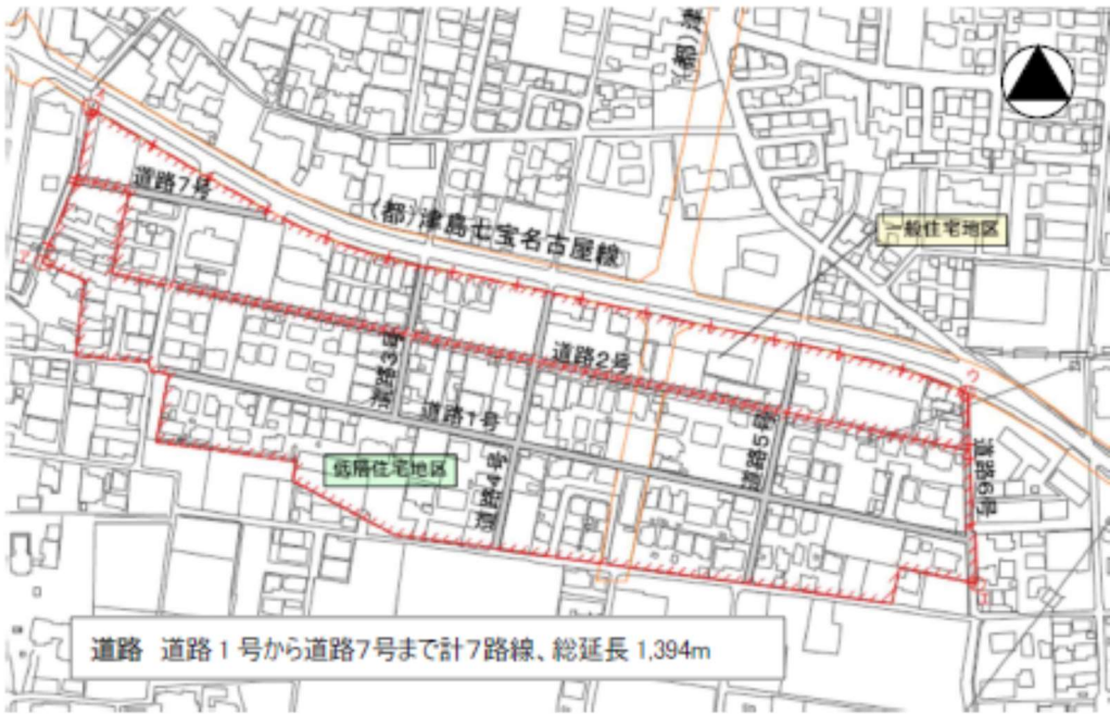
【地区として道路整備を行う箇所図】

当区域では、下記のとおり行政と住民の方々の協働で道路の整備を行います。 ○4メートル未満の道路については、今後、道路に接する土地に建物が建築される際、建築基準法に基づき、最低4メートルまでセットバックしていただき、その後、市の費用にて道路整備を行います。