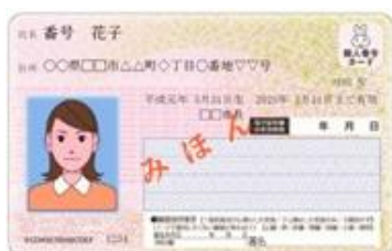
《見本:マイナンバーカード》