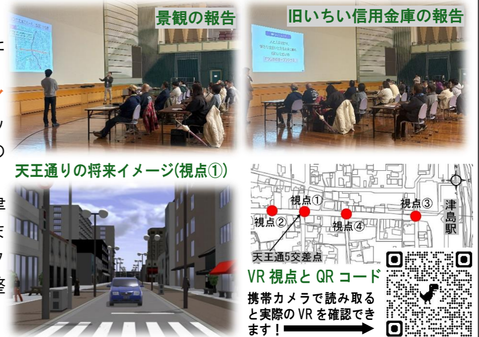
天王通りの将来イメージ(視点①)

これまでの景観ワークショップを踏まえて検討した 景観に関するルール(素案)の説明 とルール(素案)をもとに検討し、 VRで作成した天王通り周辺の将来イメージを披露 しました。これまでの景観ワークショップの内容を振り返るとともに、今後の天王通り周辺の将来イメージをVRで仮想的に共有することができ、 景観まちづくりの最前線を把握 できました！また、「津島駅周辺まちづくり構想」に掲げる津島市の今後のまちづくり方針や「わくわくアクションラボ」のワークショップ成果、今後の旧いちい信用金庫のあり方と整備方針について各担当者から内容を紹介しました。