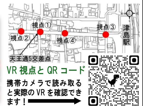
VR視点とQRコード 携帯カメラで読み取る と実際のVRを確認 できます！