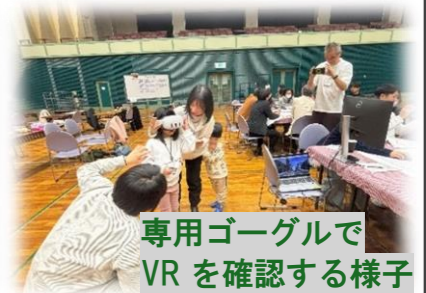
専用ゴーグルでVRを確認する様子