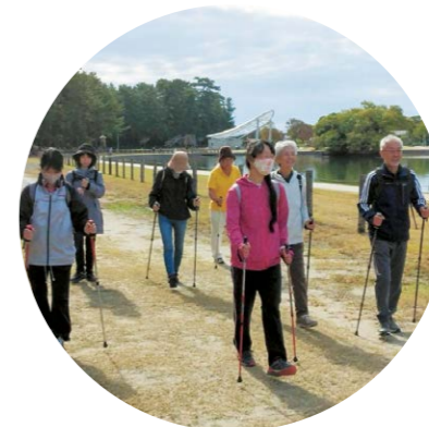
ポールウォーキング