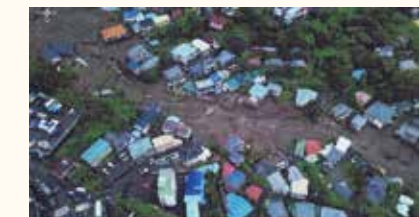
熱海土石流災害をドローンで撮影

災害発生時にカメラ搭載のドローンを利用することで 迅速かつ広範囲の被害状況を確認し、救助活動に役立ちます。