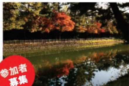
フォト：秋の遊歩道