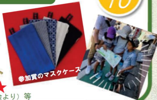
参加賞のマスクケース

マスク持参・着用と水分補給等のご協力をお願いします。 / 動きやすい服装と履き慣れた運動靴でご参加ください。