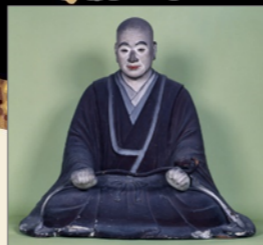
木造弥阿上人坐像 (貞和三年在銘)