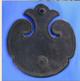
雲版(延文三年在銘)