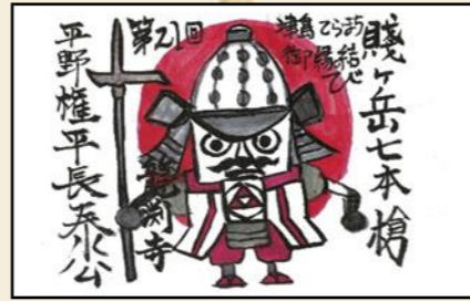
※詳細は観音寺のX(旧Twitter(@kannonji81))をご確認ください。