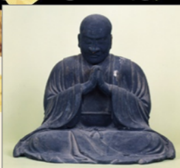
木造一向上人坐像 (文明二年在銘)