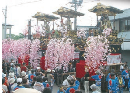
「神守山車からくり披露」