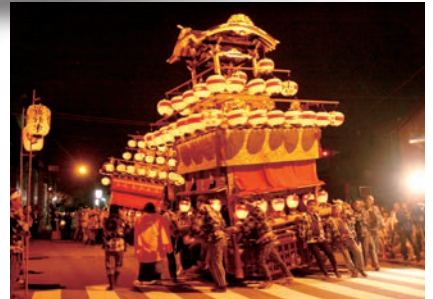
「津島山車一斉総車切」

津島の山車11台と石採祭車3車は津島駅に登場した後、天王通りを抜け、津島神社にて奉納を行います。