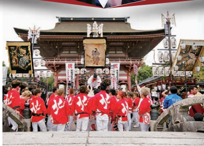
「津島山車からくり・車切披露 石採祭車競演」

この日の始まりを飾る神守の山車3台は、からくりを披露し、その後、迫力ある太鼓の音を響かせます。