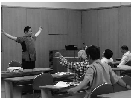
▲糖尿病教室の様子