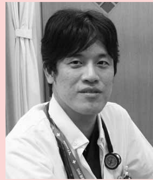
津島市民病院 循環器内科医長