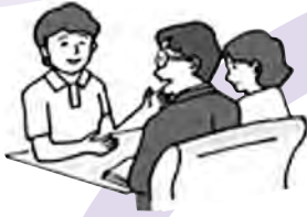
ご家族等への療養指導・療養相談

他にも、薬の飲み方・管理、精神面・心理面のケア、他のサービスとの連携等もしています。