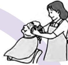
清拭・洗髪・入浴 食事・排泄の介助