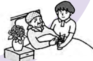
ターミナル(終末期)ケア