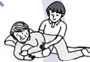
床ずれの予防と処置