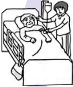
カテーテルなどの管理 (点滴・胃ろう・尿管等) 呼吸器の管理 (人工呼吸器・在宅酸素)