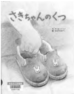
『さきちゃんのくつ』 そうまこうへい 作 まるやまあやこ 絵 フレーベル館

新しいくつをお母さんに買ってもらったさきちゃんは大よろこび。さっそくくつをげんかんにならべます。