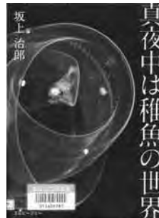
『真夜中は稚魚の世界』 坂上 治郎 著 エムピージェー

海に泳ぐたくさんのお魚たち。それらの魚にも、稚魚と呼ばれる赤ちゃんの時代がありました。日中は海の深いところで暮らし、夜になると浅場に現れる稚魚。では、彼らはどのような姿をしているのでしょうか？