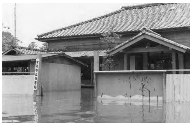
▲昭和36年集中豪雨、津島市立津島図書館