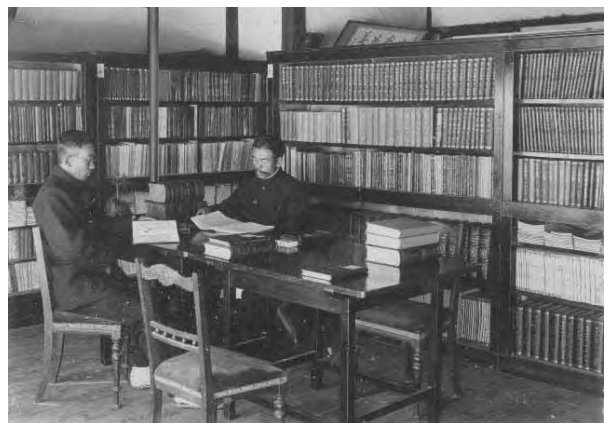
▲海東郡立戦争記念図書館