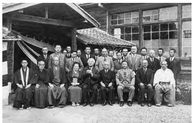
▲津島町立図書館(南門前町)、徳富蘇峰を迎えて