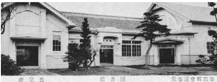
▲海部郡役所内・海部郡立図書館

昭和22年（1947）、南門前町に戻った図書館は市民の図書館として親しまれていきます。しかし、昭和34年（1959）の伊勢湾台風で建物が大きく破損、36年（1961）の集中豪雨では周囲が水没するなど被災し、その後は建