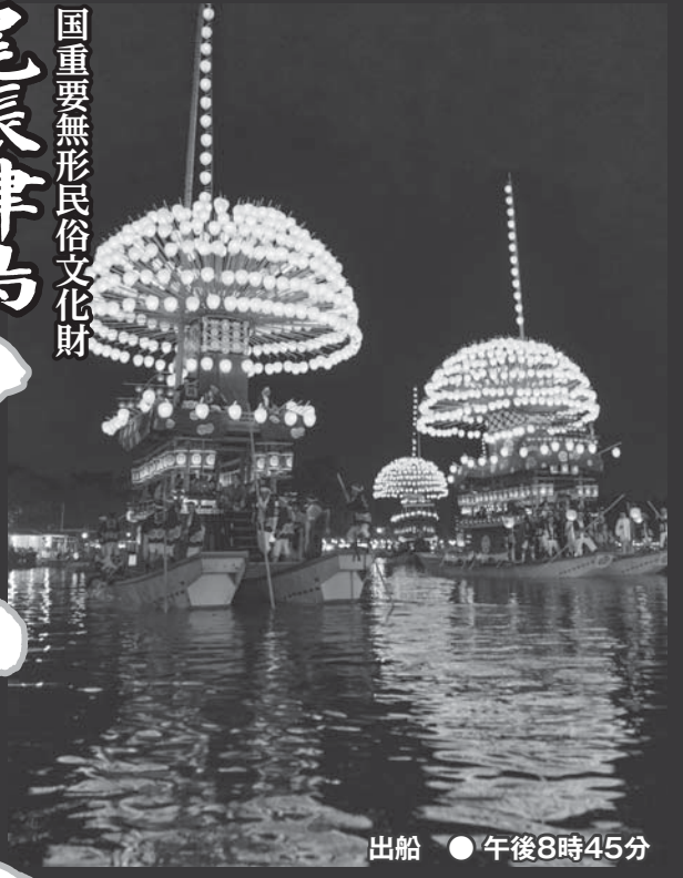
出船 ● 午後8時45分