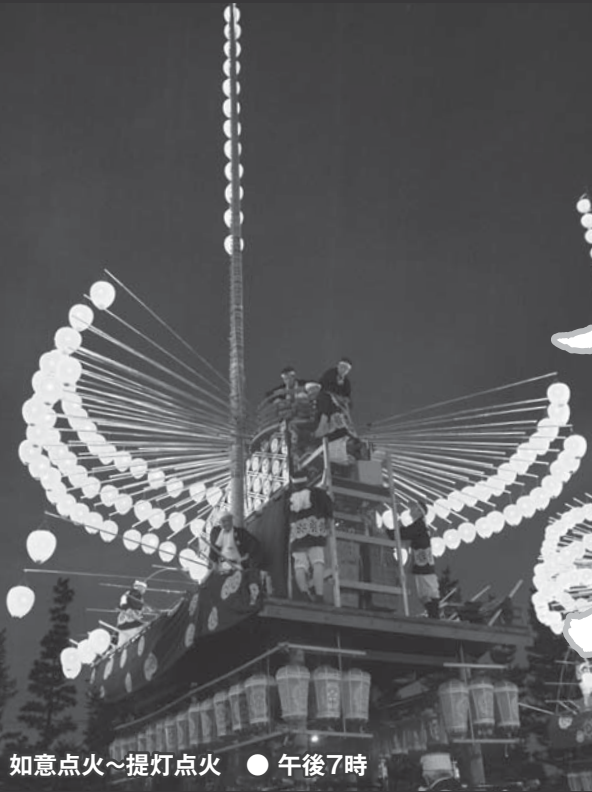
如意点火～提灯点火 ● 午後7時