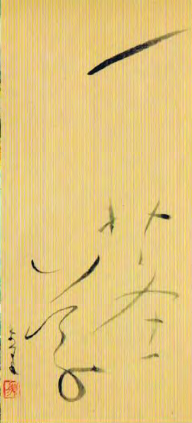
松下芝堂書「一葉草」