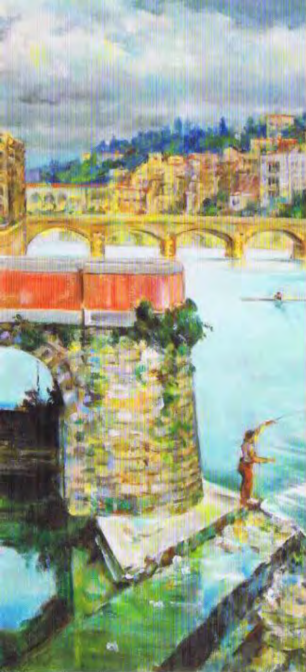
奥野広画「フィレンツェアルノ河」