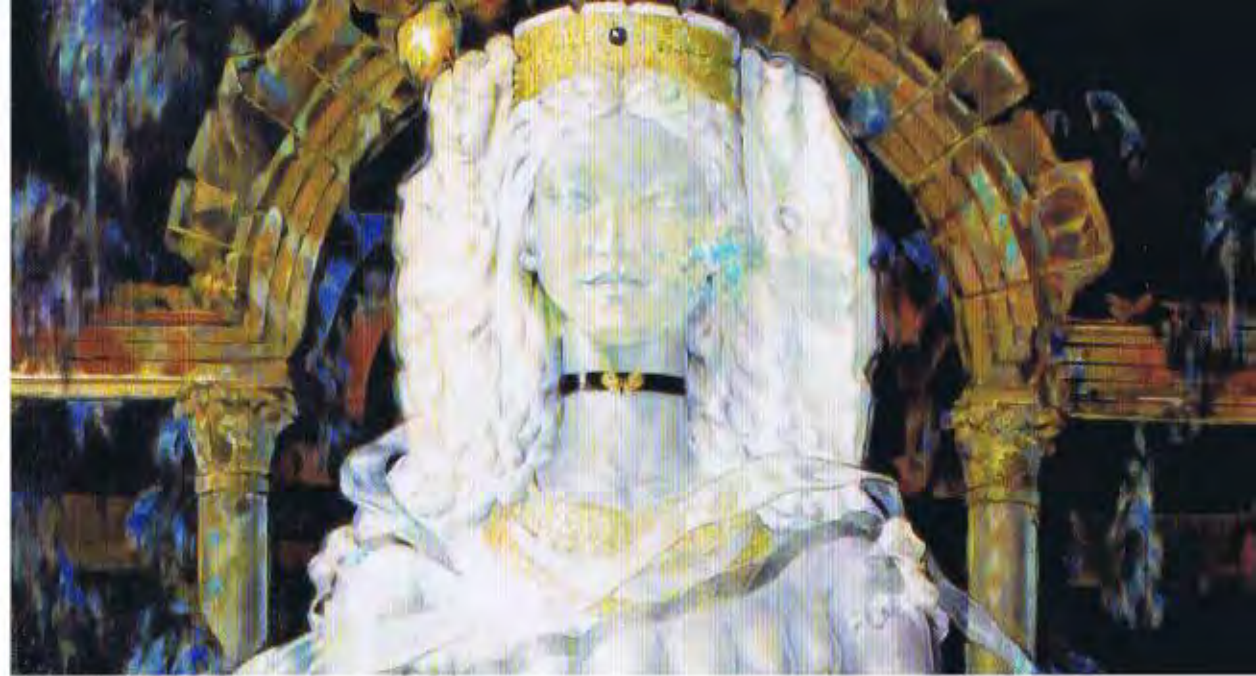
奥野広画「パムックカレー」