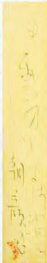
白雲のむすばは消えん朝顔の花 短冊