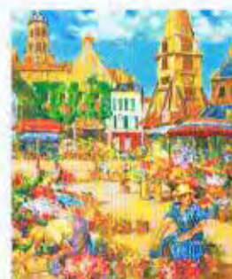
フランスオンフルールの花市 8号