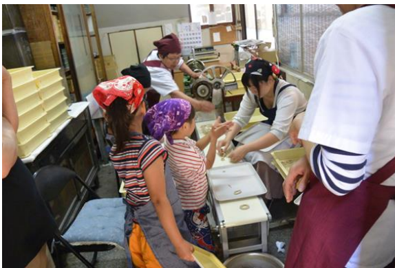
くつわづくり体験