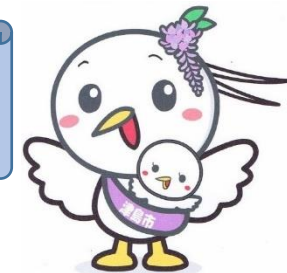
津島市子育て応援キャラクター 「つつッピー」

西（H29）・北（H30）・神守こどもの家（R4）を建設し、東小学校の余裕教室を利用してにこにこクラブを開設するなど、お子さんの過ごす環境の改善に取り組んでいます。更に令和6年度は、南こどもの家の新築に向けて実施設計業務を進める予定です。