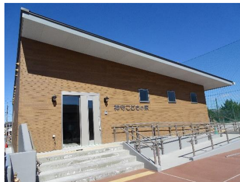
令和4年度に建設した神守こどもの家

西（H29）・北（H30）・神守こどもの家（R4）を建設し、東小学校の余裕教室を利用してにこにこクラブを開設するなど、お子さんの過ごす環境の改善に取り組んでいます。更に令和6年度は、南こどもの家の新築に向けて実施設計業務を進める予定です。